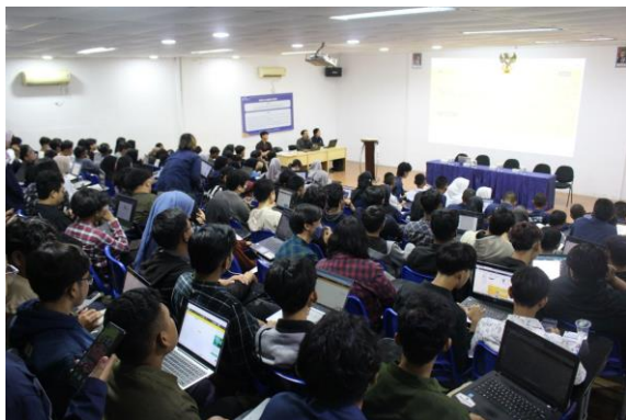
Gambar 6. Pembahasan Materi Sedina Ning UCIC

Acara berlanjut dengan penayangan video profil UCIC yang memperkenalkan berbagai aspek penting tentang kampus, diikuti dengan sesi talkshow inspiratif yang menghadirkan alumni sebagai narasumber untuk berbagi pengalaman kuliah dan dunia kerja. Mahasiswa baru kemudian diperkenalkan dengan simulasi platform pembelajaran digital yang akan digunakan selama perkuliahan, dilanjutkan dengan diskusi kelompok yang dipandu oleh dosen dan mahasiswa senior untuk memberikan ruang interaksi dan tanya jawab seputar dunia perkuliahan seperti pada Gambar 6 dibawah.