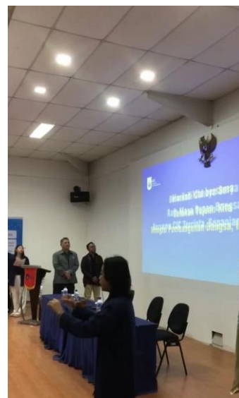
Gambar 3. Menyanyikan Lagu Indonesia Raya dan Mars CIC oleh HIMABIS

Rundown diatas adalah susunan acara yang biasanya digunakan oleh panitia penyelenggara mau itu HIMA ataupun BKM untuk menyelenggarakan acara. Dimana rangkaian kegiatan “Sedina Ning UCIC” ini dimulai dengan sesi pembukaan. Pada waktu ini, seluruh peserta mengikuti prosesi menyanyikan lagu kebangsaan Indonesia Raya sebagai bentuk penghormatan terhadap negara, kemudian dilanjutkan dengan menyanyikan Mars CIC guna menumbuhkan semangat dan identitas kebersamaan sivitas akademika seperti pada Gambar 3.