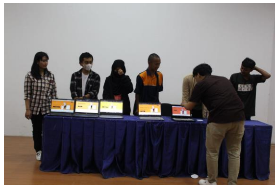
Gambar 7. Unjuk Kebolehan peserta

Menjelang akhir acara, para peserta mengikuti serangkaian games interaktif, kuis berhadiah serta unjuk kebolehan yang bertujuan meningkatkan kekompakan dan kerja sama antar individu seperti pada Gambar 7. Selain itu, ditampilkan pula hasil karya mahasiswa sebagai bentuk apresiasi terhadap kreativitas. Seluruh rangkaian kegiatan ditutup pada sesi akhir ini dengan penutupan acara secara resmi.