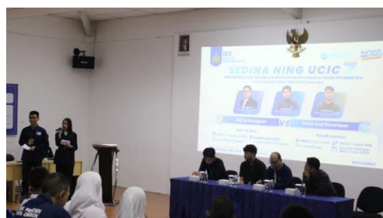
Gambar 4. Sambutan Pembukaan Acara Sedina Ning UCIC

Kegiatan dilanjutkan dengan sambutan dari pihak universitas, termasuk pimpinan UCIC dan ketua umum panitia. Sambutan ini bertujuan untuk memberikan gambaran umum mengenai kegiatan serta memotivasi mahasiswa baru seperti contoh pada Gambar 4. Setelah itu, dilaksanakan sesi dokumentasi berupa foto bersama antara peserta, panitia, dan narasumber seperti pada Gambar 5.