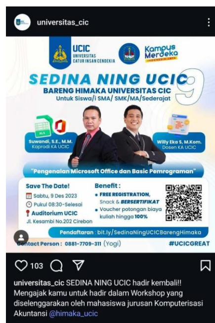
Gambar 2. Poster Sosialisasi oleh HIMAKA

komunikasi kampus, seperti media sosial resmi, grup percakapan daring, dan pemberitahuan dari pihak akademik seperti pada contoh Gambar 2. Sosialisasi ini bertujuan untuk memberikan pemahaman menyeluruh mengenai maksud serta tujuan kegiatan, sekaligus memotivasi mahasiswa baru agar terlibat secara aktif. Tanggapan yang diterima dari calon peserta menunjukkan antusiasme yang tinggi, ditandai dengan banyaknya interaksi dalam kanal komunikasi dan tingkat kehadiran yang optimal saat pelaksanaan.