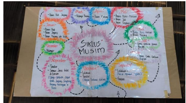
Gambar 1. Siklus Musim Hasil Observasi Terhadap Laku Tani Masyarakat Wintaos.

Selain melakukan observasi partisipatoris, kami juga berdiskusi bersama kelompok anak-anak yang menjadi dampingan Sekolah Pagesangan. Diskusi ini dilakukan setiap awal musim sinau untuk mengidentifikasi minat anak-anak. Anak-anak dampingan Sekolah Pagesangan sebenarnya tidak dibatasi usia, tetapi rata-rata usia jenjang SD, SMP, dan SMA. Dalam melaksanakan diskusi kami memberikan kesempatan setiap anak untuk menyampaikan hal yang disukai, hal yang kurang disukai, hal yang membuat lelah, dan hal yang ingin dilakukan, tetapi dilarang oleh orang tua. Melalui diskusi ini kami juga ingin mengakomodasi minat anak-anak. Rata-rata aktivitas yang disukai anak-anak adalah aktivitas fisik, seperti petualangan dan jelajah, permainan, memasak, bertani, dan lain-lain.