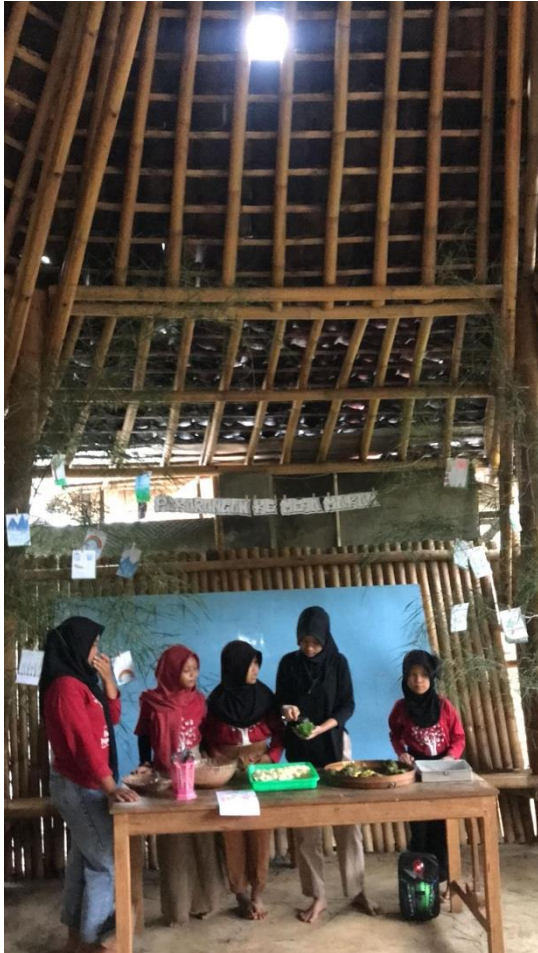
Gambar 6. Demo Pembuatan Pecel Kimpul dalam Presentasi Hasil Belajar.

Tahap terakhir dari siklus belajar di Sekolah Pagesangan adalah refleksi. Tahap akhir bukan berarti akhir dari belajar, justru menjadi pijakan baru untuk tahap belajar selanjutnya. Inilah yang dinamakan daur belajar. Sebuah proses belajar yang tidak berhenti sepanjang hayat. Kami melakukan refleksi bersama. Semua orang boleh memberi respon dan tanggapan kepada semuanya tanpa hierarki. Fasilitator dan anak-anak memiliki kedudukan yang setara. Sehingga dapat saling belajar dan berefleksi.