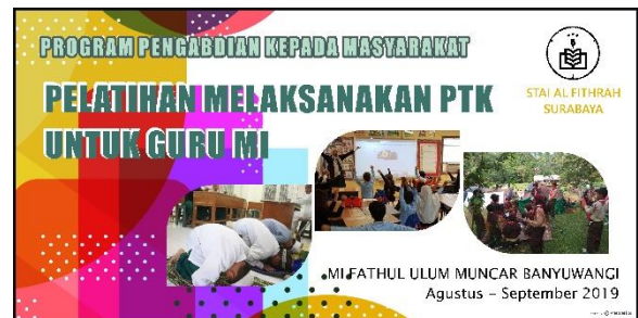
Gambar 3. Desain poster untuk saat kegiatan sosialisasi materi.

Tidak ada kendala yang ditemui selama tahapan persiapan (gambar 1). Kegiatan berjalan lancar, koordinasi dengan pihak kepala sekolah dan kepala sekolah juga berjalan dengan sangat baik. Penyusunan materi sebagai pesan utama pengabdian juga berjalan lancar. Pada tahapan persiapan ini selain berkoordinasi dan menyusun materi juga merancang sertifikat, poster, serta hal-hal lain yang bersifat komplementer tetapi dapat memunculkan motivasi bagi peserta (guru). Untuk rancangan poster lihat gambar 3, dan rancangan sertifikat lihat gambar 4.