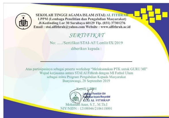
Gambar 4. Desain sertifikat untuk guru yang telah selesai mengikuti kegiatan pelatihan.

Pada tahap kedua yaitu tahap pelaksanaan peserta pelatihan yaitu guru-