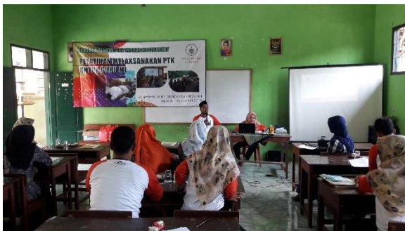
Gambar 6. Sharing pengalaman oleh bapak dan ibu guru yang pernah melaksanakan PTK.

Selama proses pelaksanaan pelatihan/pembekalan klasikal tidak hanya dihadiri oleh MI Fathul Ulum tetapi juga diikuti oleh MI Unggulan Al-Muttaqin dengan alamat Desa Bagorejo Kecamatan Srono Kabupaten Banyuwangi. Keikut-