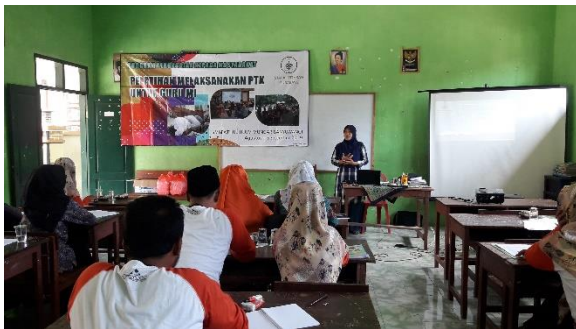
Gambar 5. Pembekalan materi dan pelatihan melaksanakan PTK.

Setelah kegiatan diskusi dan diketahui data tentang pengalaman guru terhadap PTK maka dilaksanakan pembinaan dan pembekalan klasikal (lihat gambar 5 dan 6). Selama pembekalan tersebut semua guru aktif untuk bertanya tentang PTK lebih dalam, termasuk kelebihan-kelebihan jika bagi guru jika melaksanakan PTK serta sanksi atau kerugian-kerugian yang didapat jika tidak pernah melaksanakan PTK.